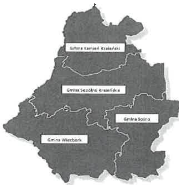
Mapa 1. Gminy wchodzące w skład LGD Stowarzyszenia NASZA KRAJNA